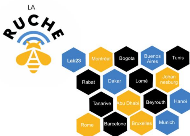
En bleu, les zones expérimentales et le Lab'23

Force de proposition, l'administrateur impulse l'innovation, opère une veille des besoins en zone, repère les pratiques innovantes du réseau